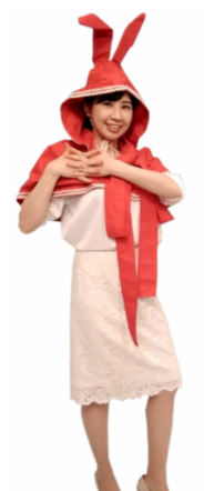
♪ わたしを そのまま右胸