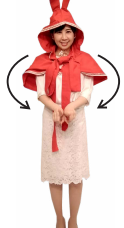
♪ て 下であわせます