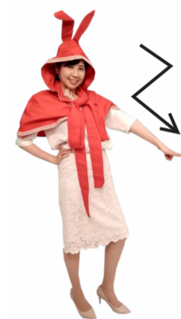
♪ を ジグザクに下に 振ります