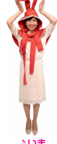
♪ いま 両手を頭に ウサギのポーズ