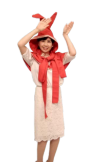
♪ きふちゃん 手と足を右左振ります