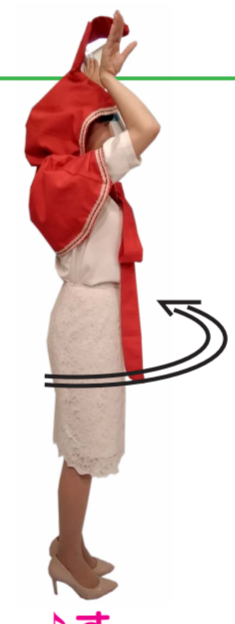
♪ す びよんびよんと 一周します