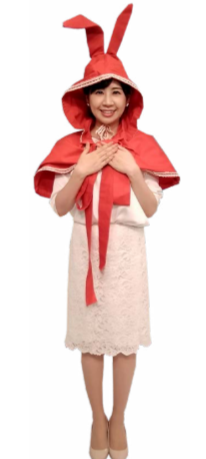
♪ かな 右手も胸に