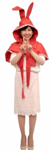
♪ あい 両手をくっつけて 人差し指を立てます