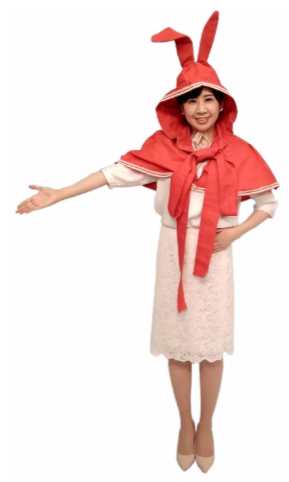
♪ みんな 右手を広げて