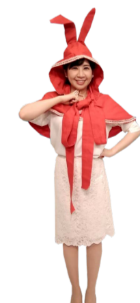
♪ きふ 右手の拳を胸に