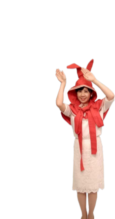
♪ きふちゃん 逆方向に 手と足を右左振ります