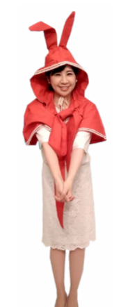
♪ むす 手をすくい上げる