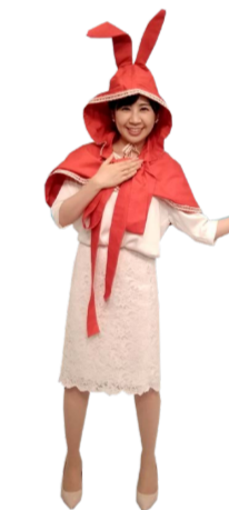
♪ ころろ 右手を胸に 左手を広げます