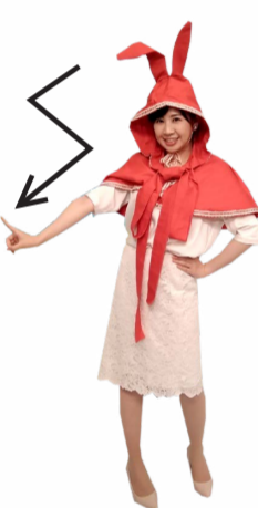
♪ パーセント ジグザクに下へ