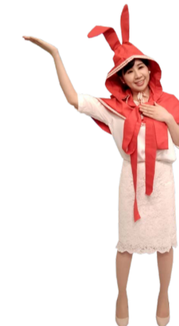
♪ ひろがる 左手を胸に 右手を上広げます