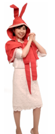
♪ きの 両手を左