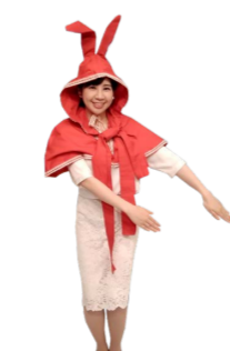
♪ きふ 両手を斜め下にそろえて