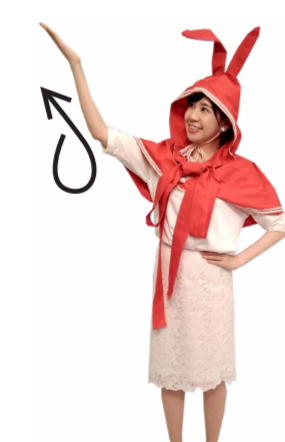
♪ のぞみを 伸ばした手をくるっと 一回転