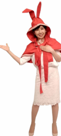
♪ ゆた 左手を胸に 右手を広げます