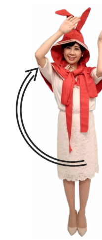
♪ チャン くるっと うさちゃんポーズ