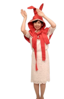
♪ きふちゃん 逆方向に 手と足を右左振ります