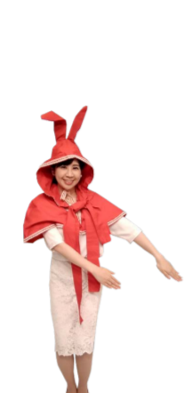
♪ きふ 両手を斜め下にそろえて