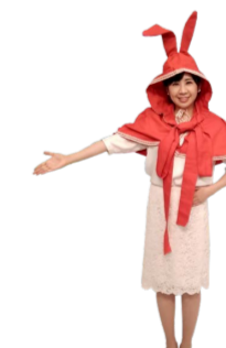
♪ みんな 右手を広げて