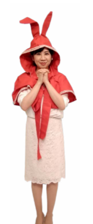
♪ ふ 両手をあわせてまま 胸に