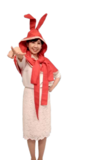
♪ チャンネルは 前に指を突き出します