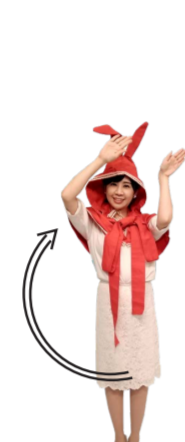
♪ チャン くるっと うさちゃんポーズ