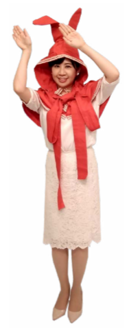
♪ きふちゃん 逆方向に 手と足を右左振ります