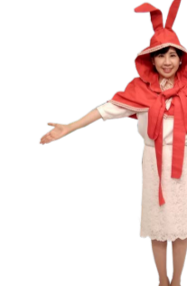
♪ なの 左手も広げます