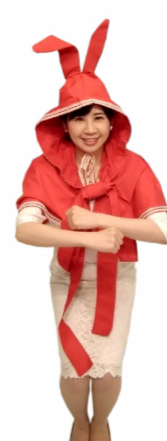
♪ しゃがんで 腕をくるくる