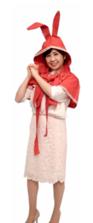
♪ ちい 両手を右