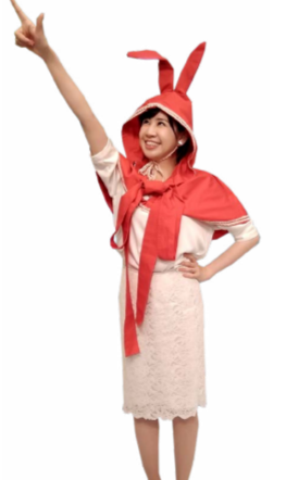
♪ いハ 拳を上伸ばし 指を突き出します