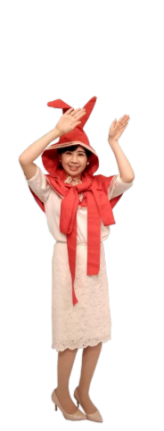
♪ きふちゃん うさちゃんポーズで 手と足を右左振ります