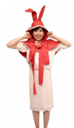
♪ つづ 今度は両手の拳を肩に