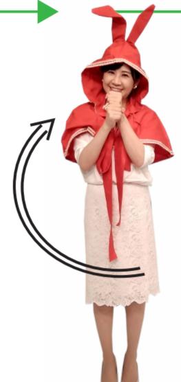
♪ チャン くると口元で マイクポーズ