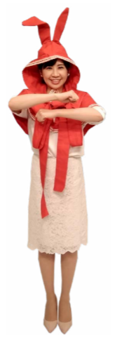
♪ 腕をくるくるしながら起き上がります