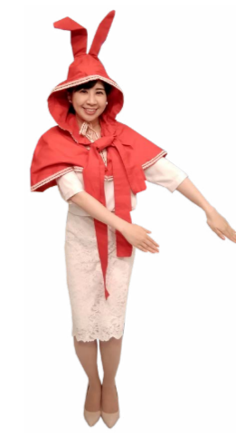
♪ きふ 両手を斜め 左下にそろえて