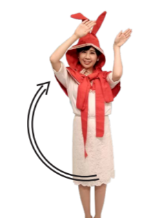
♪ チャン くるっと うさちゃんポーズ