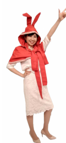
♪ きふ 同じように 左手で指を上伸ばし