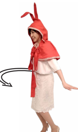
♪ ネルは 一周します