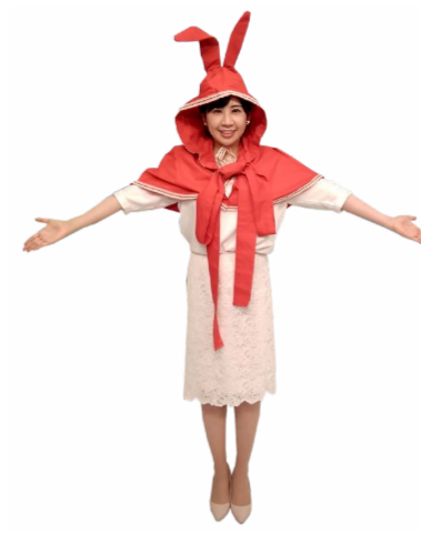
♪ なの 左手も広げます