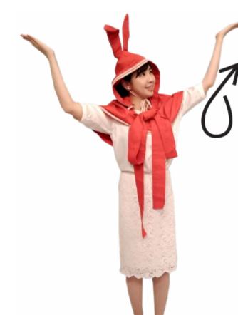
♪ たくし 左手もくるっと 一回転して上に