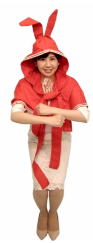
♪ しゃがんで腕をくるくる