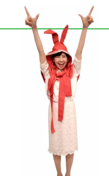
♪ け 両手の拳を上伸ばし 指を突き出します