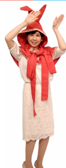
♪ きふちゃん うさちゃんポーズで 手と足を右左振ります