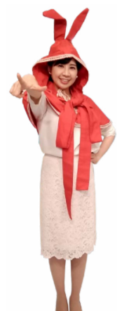
♪ チャンネルは 前に指を突き出します