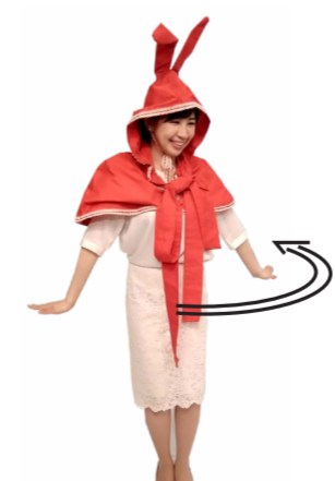
♪ チャン 両手を下に広げつつ くるっと