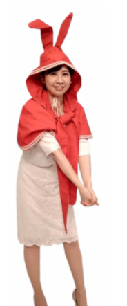
♪ きふ 左から すくい上げる