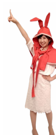
♪ 100 右手で指を上伸ばし