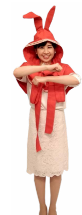
♪ 腕をくるくるしながら 起き上がります