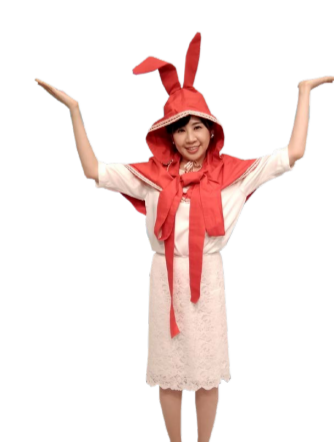
♪ あすに 左手も上に 広げます