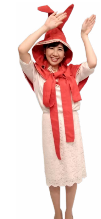
♪ きふちゃん うさちゃんポーズ