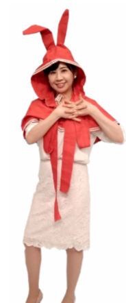
♪ あなたと 両手をあわせて 左胸