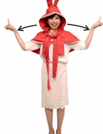
♪ し 円を描くように