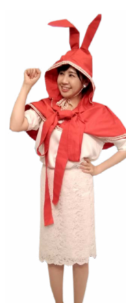
♪ みら 左手を腰に 右手の拳を肩に